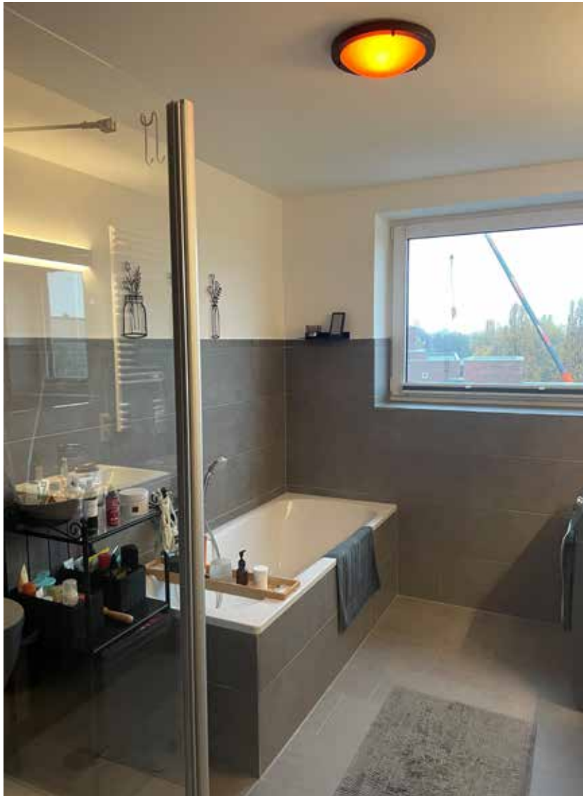
Badezimmer linke Seite