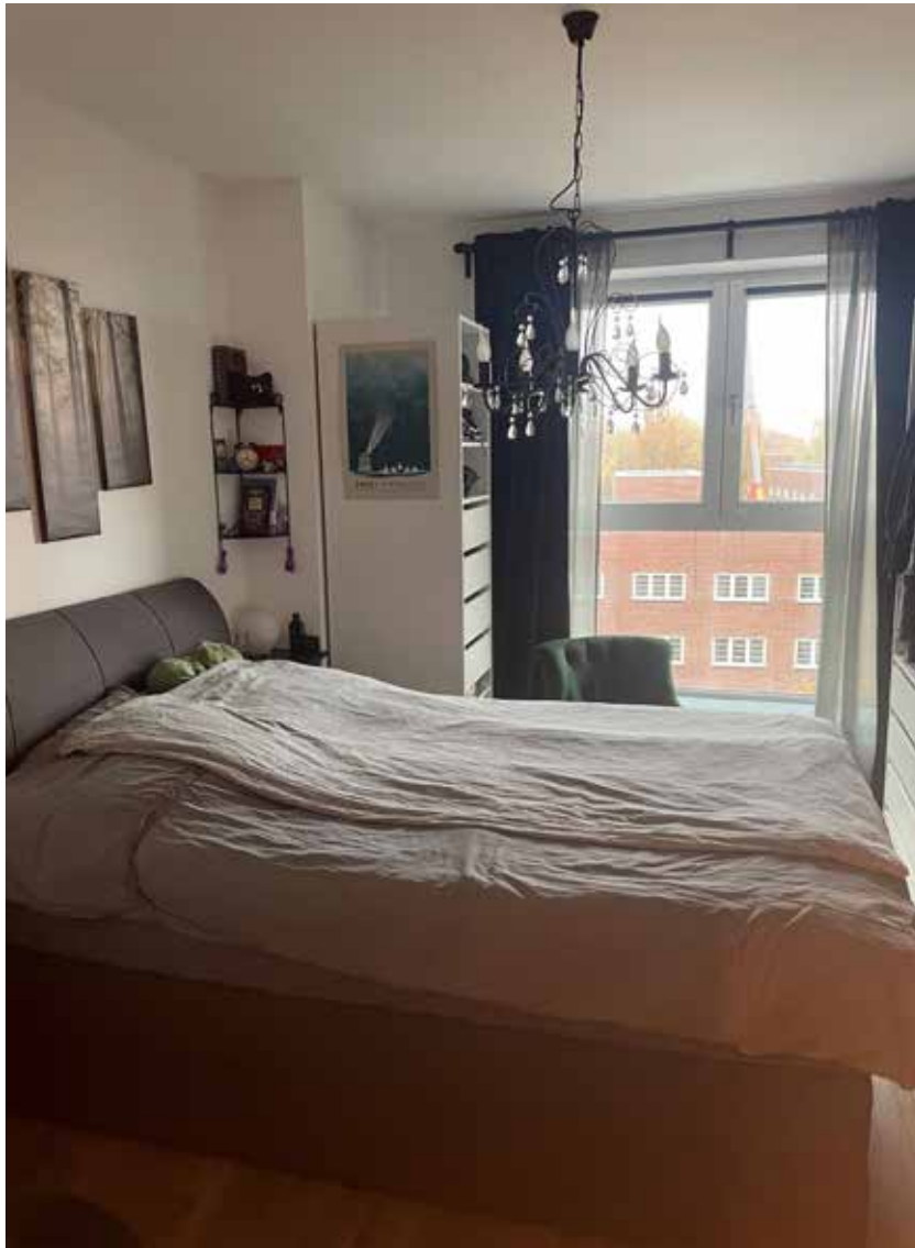
Schlafzimmer 5. OG